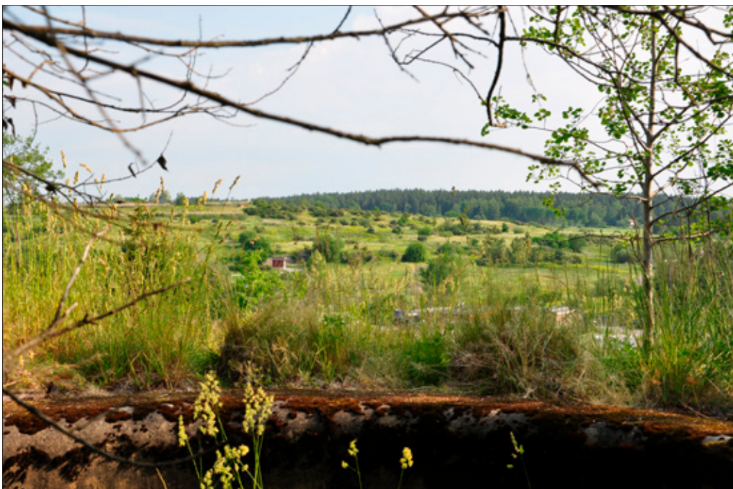
Figur 14. Utsikt från eldledarställningen i Hagbybatteriet (L2014:694/Täby 453:1). Den omgivande Hagbytippen anas i förgrunden. Foto från SV.