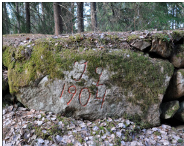
Figur 7. Minnessten i skyttevärn anlagt av soldater från I2 med texten ifyllt med röd färg (L2019:2768).