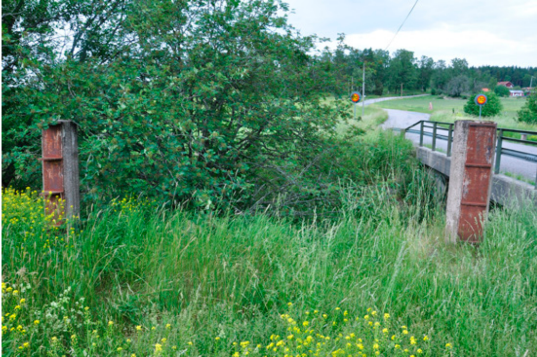
Figur 15. Rester av vägspärren vid Fällbro (L2019:2802) som tillsammans med närbelägna skyttevärn (se figur 5) och talrika runstenar (en syns vid vägen i bakgrunden) bildar en intressant kulturmiljö vid Skålhamravägen. Foto från S.