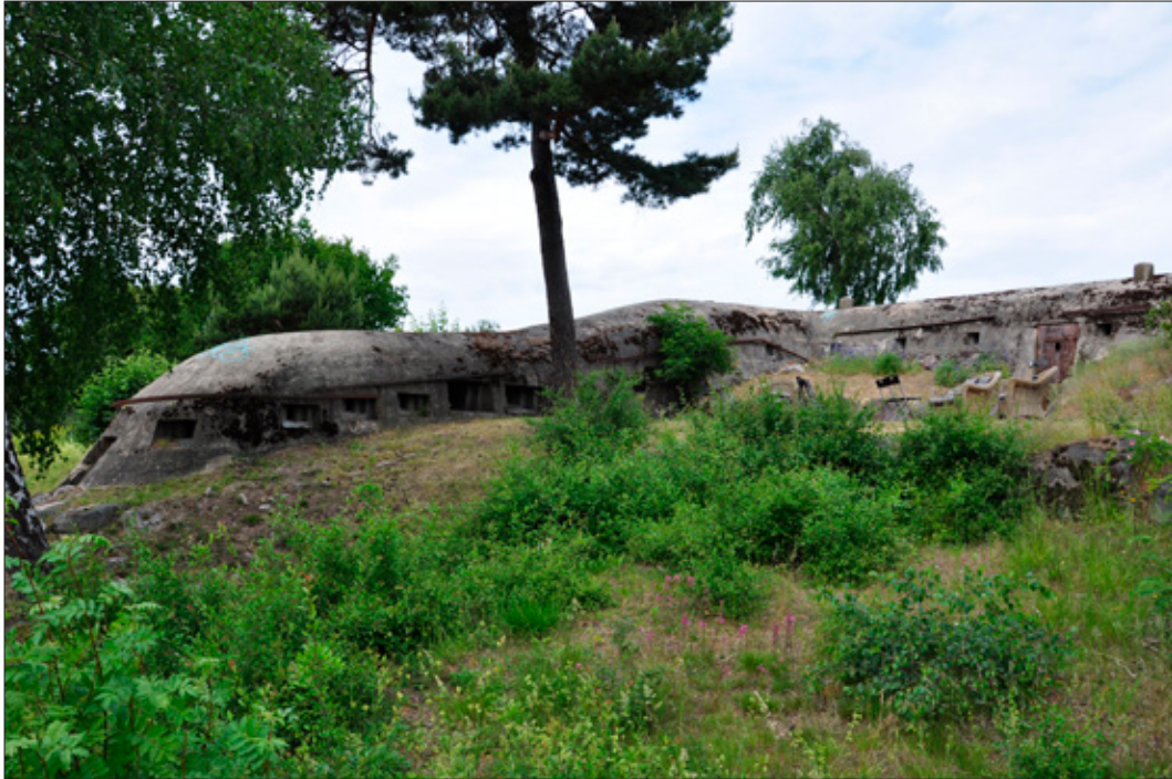
Figur 11. Västra Arningefortet (L2019:2760) ligger i Arninge handelsområde och är sedan tidigare oregistrerad. Anläggningen är något hårt restaurerad men är både synlig och lättåtkomlig.