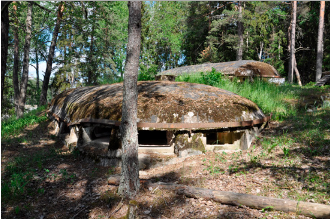
Figur 9. Skogbergafortet (L2014:1717/Täby 441:1) består av två planskilda gallerier och avviker i konstruktionen från övriga fort. Foto från SV.