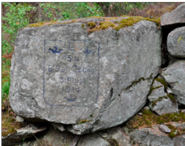
Figur 6. Minnessten i skyttevärn anlagt av Landstormens (L2014:936/Täby 423:2) och ifyllt med blå färg. Foto från V.