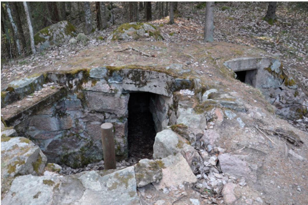
Figur 16. Ett kulsprutevärn vid Skavlöten ((L2014:1613/Täby 424:1) med kulsprutestativ och täckt förbindelsevärn/ammunitionsförråd. Försvarslinjen kompletterades med flera sådana värn under andra världskriget. Foto från Ö.