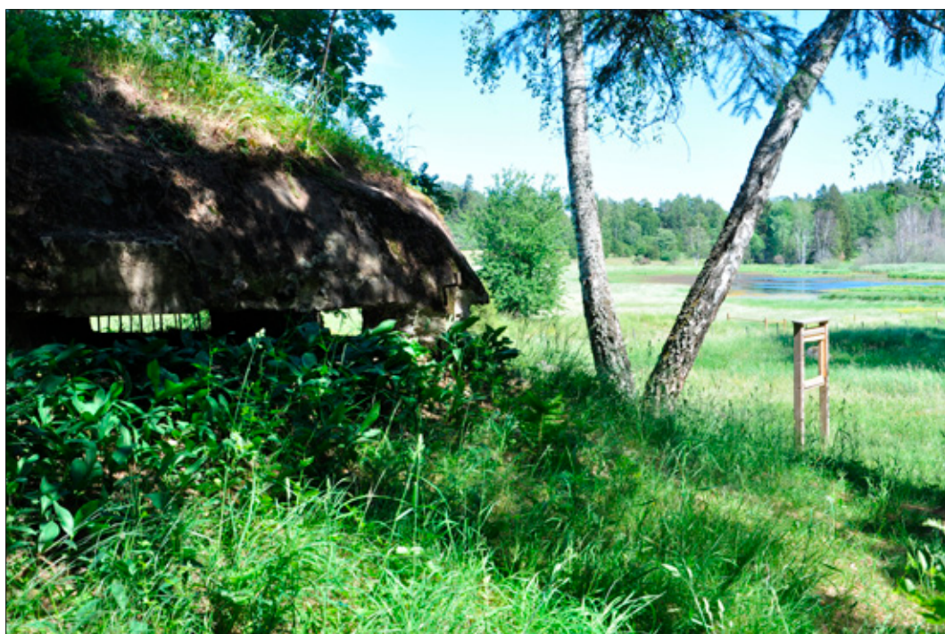
Figur 8. Prästgårdsfortet (L2014:1349/Täby 443:1). Taket har med tiden blivit täckt av vegetation, precis som det ursprungligen var tänkt. Utsikten har inte förändrats nämnvärt på hundra år och är densamma kulsprutebesättningen innanför skottgluggarna till vänster skulle haft i början av 1900-talet.. Foto från SV.