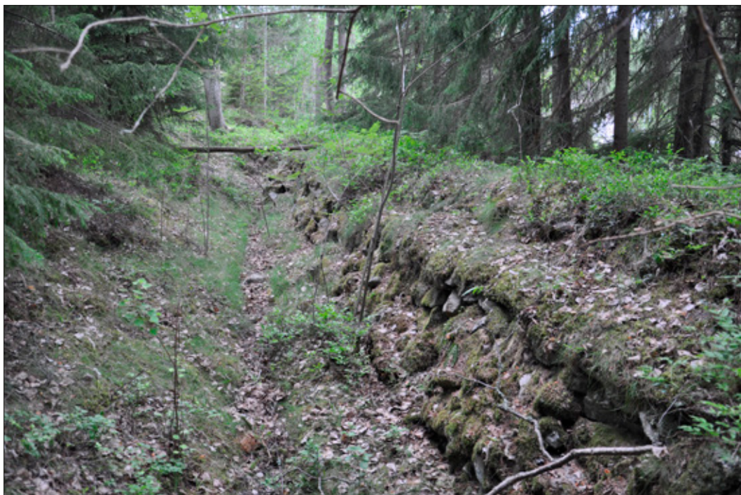
Figur 4. Skyttevärn (L2014:1517/Täby 437:1) bestående av skyttegrav till vänster och vall till höger. Notera fotstöd och armbågsstöd för gevärsskyttarna. Foto från NÖ.