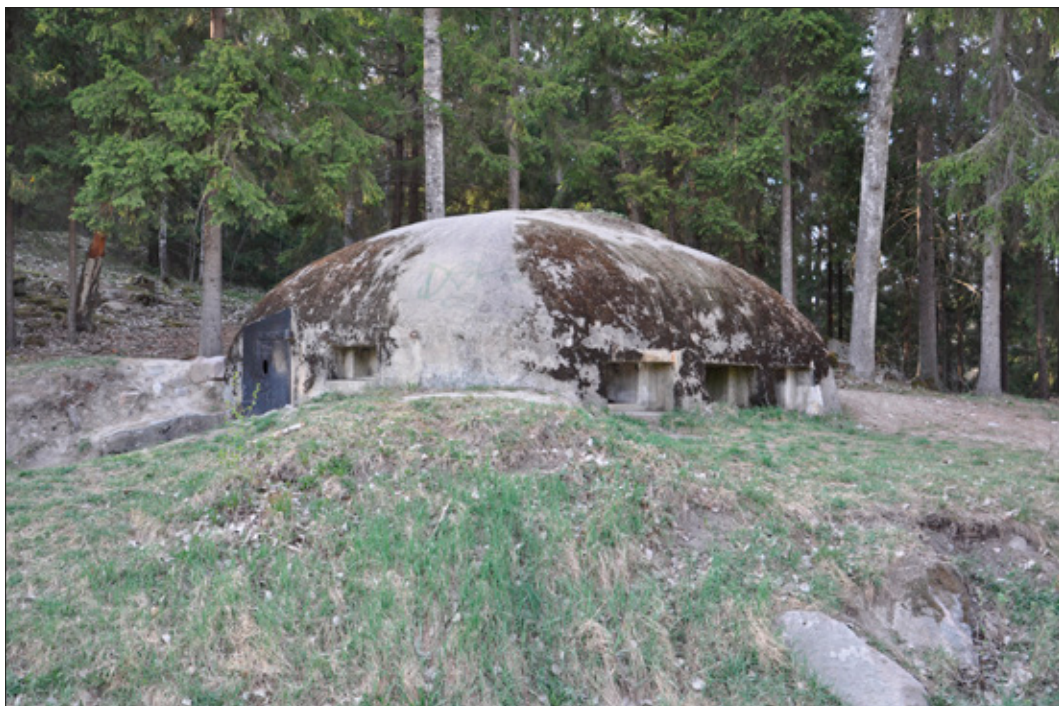
Figur 12. En av de två små bunkrarna vid Skavlöten (L2014:1613/Täby 424:1). Foto från Ö.