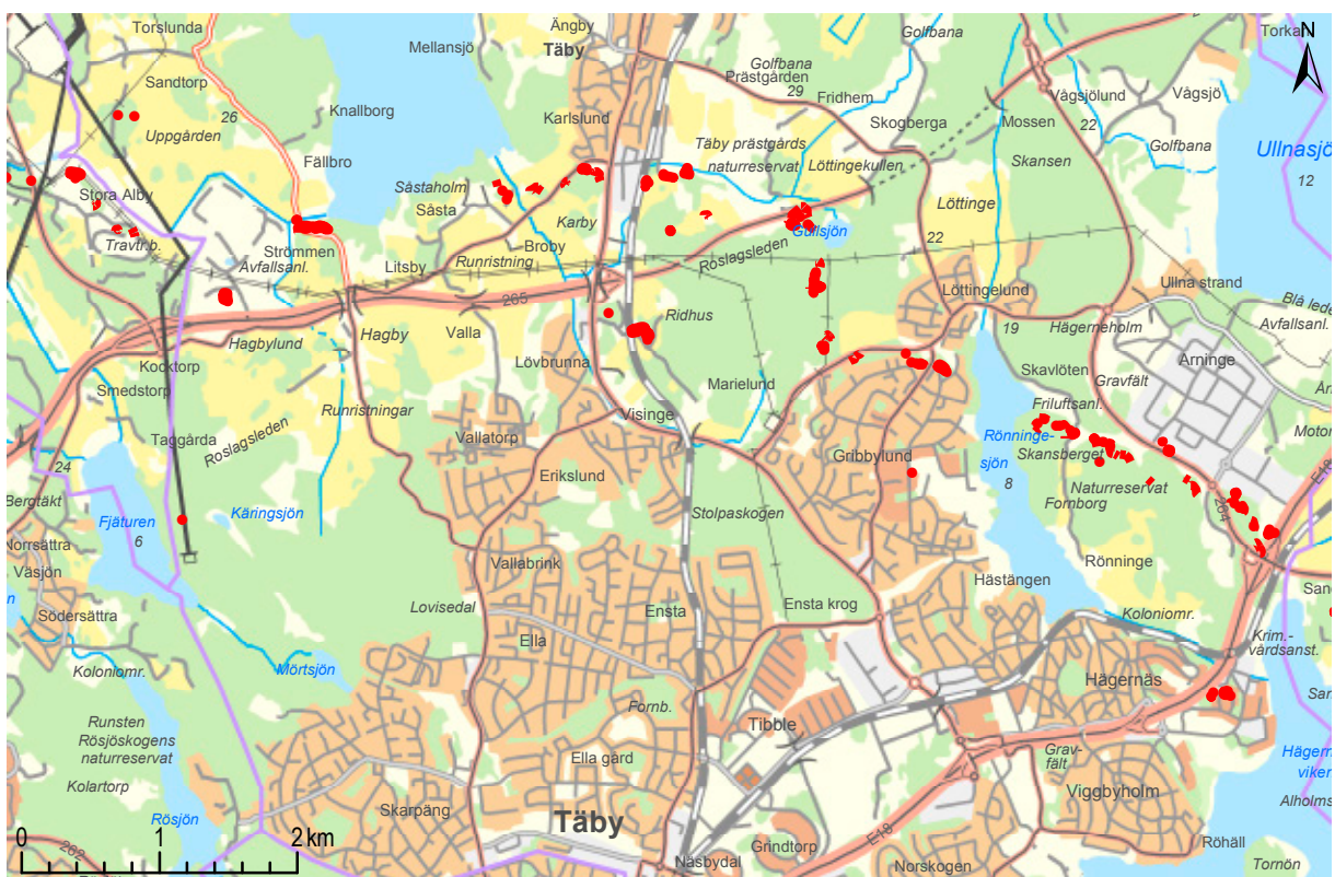
Figur 2. De militära lämningar i Täby som ingått i uppdraget. Lämningarna väster om gränsen till Upplands Väsby (lila färg) i västra delen av kartan inte ingår i uppdraget. Samtliga anläggningar med undantag för de tre lämningarna närmast öster om kommungränsen, vid Uppgården resp. Fjäturen, har ingått i Norra fronten. Skala 1:60 000.