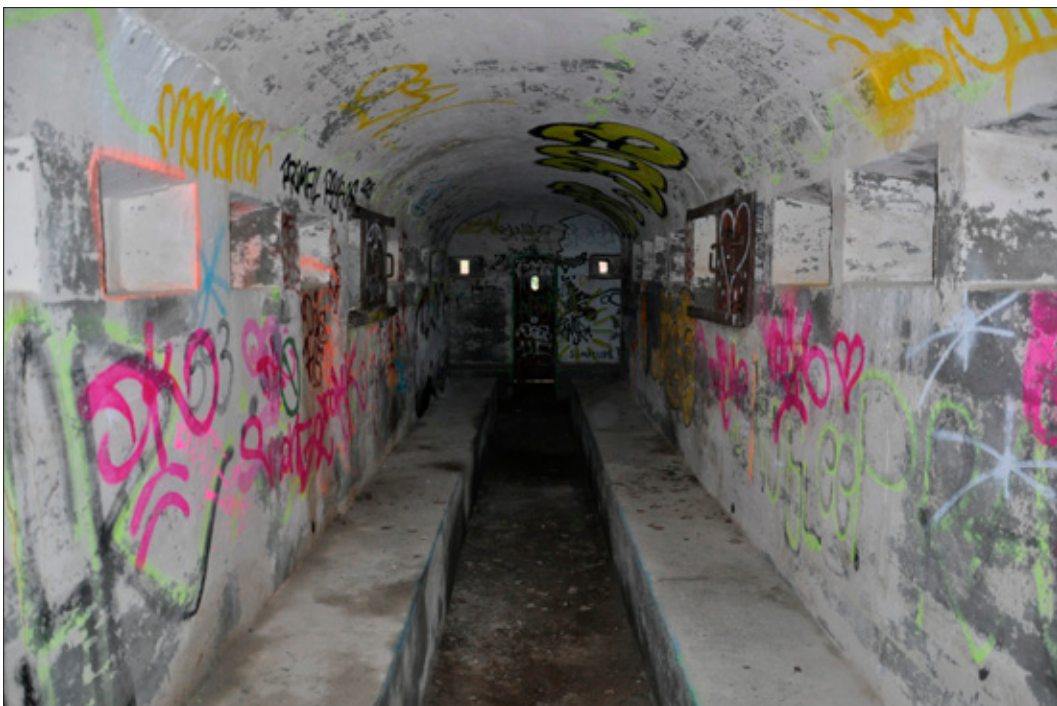
Figur 10. Bunkrarna är i gott skick invändigt, om än nedklottrade. Gullsjöfortet (L2014:1583/Täby 439:1) är ett typiskt exempel med långsgående bänkar/fotstöd, små skottgluggar samt en ståldörr med lucka i fonden. Foto från Ö.