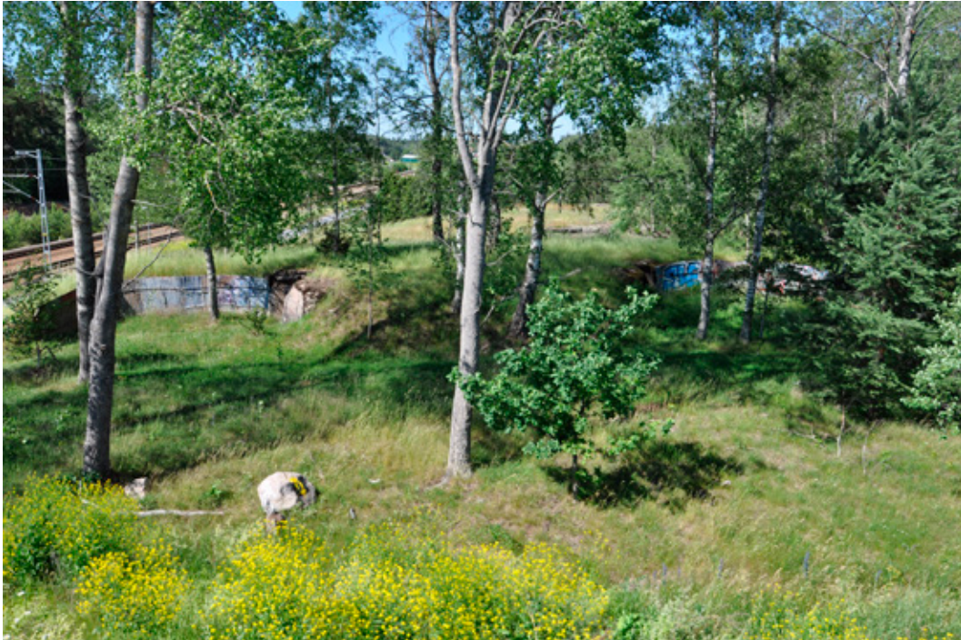
Figur 13. Karbybatteriet (L2014:693/Täby 452:1) är den bäst bevarade artilleriställningen. På fotot syns de två västra pjäsvärnen som två halvcirkelformade ytor med korrugerad plåt mot skyddsvallen. Under vallen mellan värnen är ett underjordiskt granatskjul med ingång från båda hållen. Foto från S.