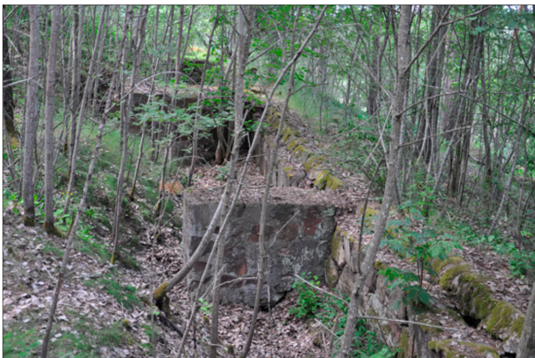
Figur 5. Det övre skyttevärmnet i 2014:1993/Täby 446:1 är sannolikt det sist anlagda i Norra fronten (ca 1920) och mycket välanlagt. Skyttegravens är delvis nedsprängt i berggrunden, med murade tvärmurar och jämna arm- och fotstöd. Foto från SÖ.