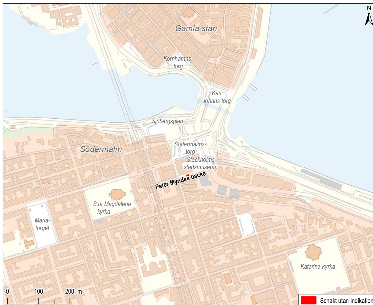
Figur 2. Schaktet grävdes i Peter Myndes backe vid Södermalmstorg. Mot bakgrund av Fastighetskartan, skala 1:7 500.

utfördes i början av mars 2020 på uppdrag av Länsstyrelsen i Stockholms län (Lst dnr 431-8042-2020). Syftet med undersökningen var att med ett vetenskapligt arbetssätt dokumentera fornlämningen om anläggningar eller konstruktioner skulle framkomma i samband med schaktningen.