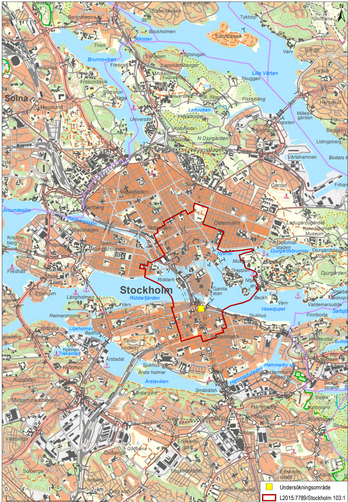
Figur 1. Undersökningsområdet i Peter Myndes backe vid Södermalmstorg i centrala Stockholm. Mot bakgrund av Terrängkartan, skala 1:50 000.