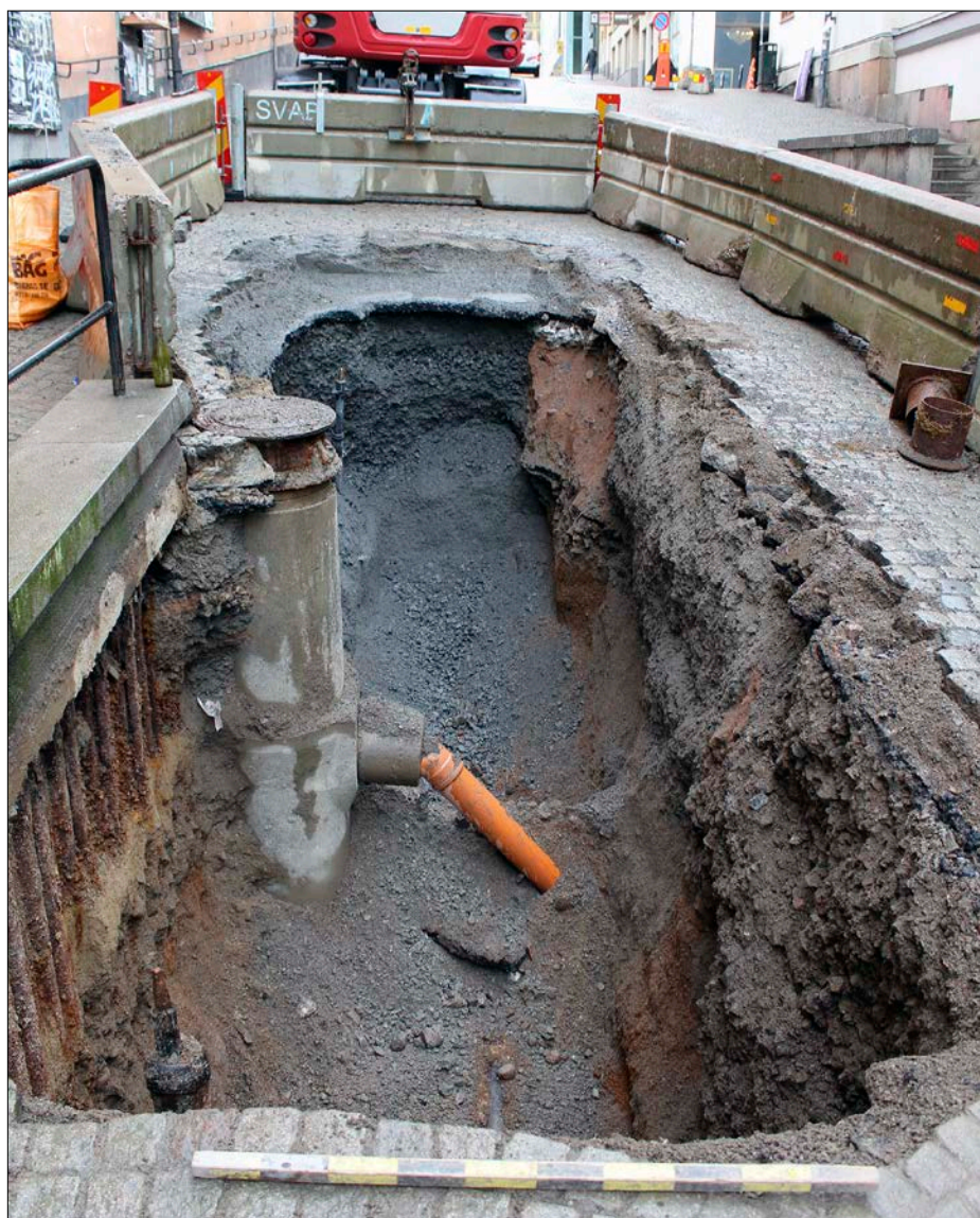
Figur 4. Foto över schaktet i Peter Myndes backe. Foto från ostnordost.

nästan uteslutande av homogen makadam bestående av sentida krossten. I den norra schaktväggen bestod materialet av sandig och stenig makadam med inslag av rödfärgad sand (figur 4). Inget av arkeologiskt intresse påträffades vid schaktningen.