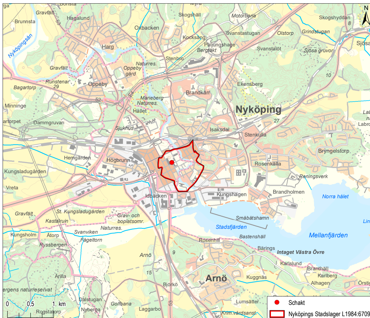
Figur 1. Platsen för schaktningsövervakningen mot bakgrund av Terrängkartan, skala 1:50 000.

Kommun: Nyköpings kommun Fastighet: Slottsgatan 1 Lämningsnr i KMR: L1984:6709 Projektledare: Sverker Holmqvist Layout: Medea Nyström Huuva Utförandetid fältarbete: 20210112 Koordinatsystem: SWEREF99 TM Höjdsystem: RH 2000 Fynd: Inga fynd tillvaratogs