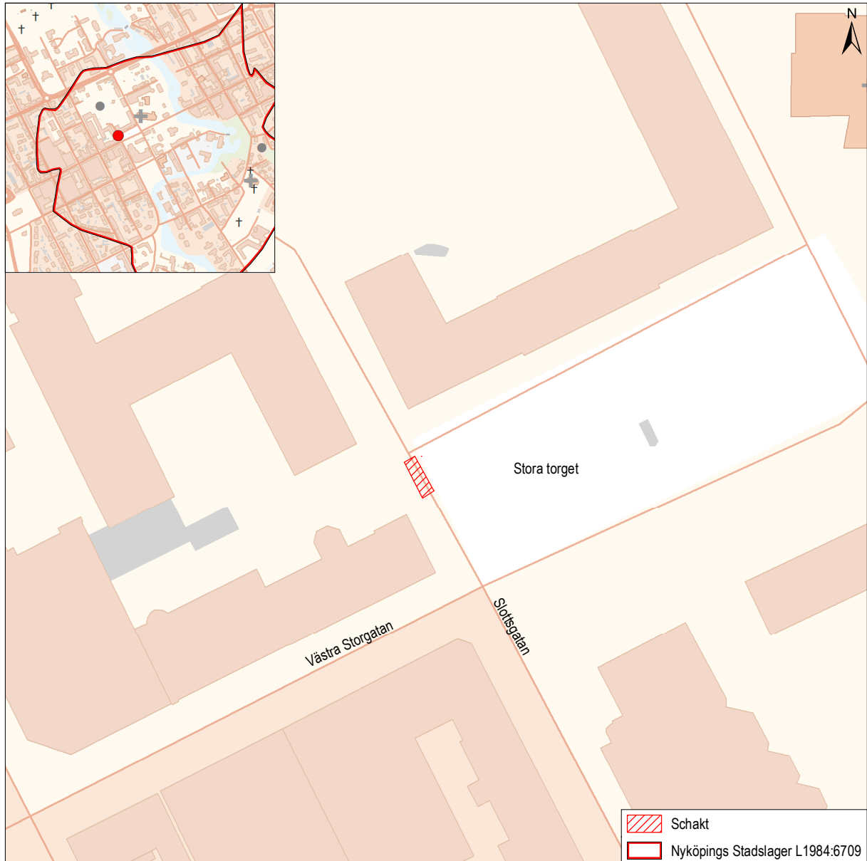
Figur 2. Schaktets läge på Stora Torget i Nyköping mot bakgrund av Fastighetskartan, skala 1:1 000. Översikt i skala 20 000:

Schaktet mätte 7,5 x 2,5 meter i plan och grävdes som djupast ned till 2,1 meter under marknivå. Inga äldre konstruktioner, artefakter eller andra lämningar av antikvariskt värde framkom.