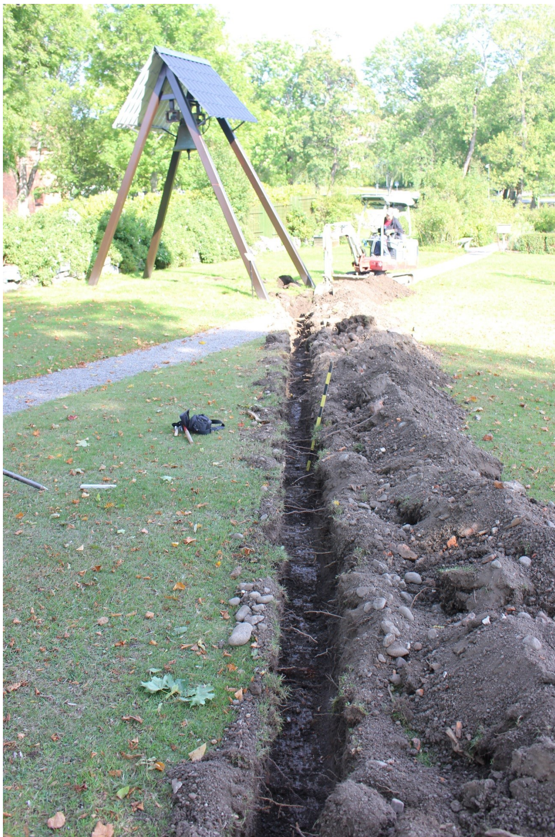
Figur 2. Undersökningsschaktet i riktning mot klockstapeln. Den tillfälliga klockstapeln har uppförts i väntan på att den nedbrunna klockstapeln ska ersättas med en ny på Klockbacken. Foto från västsydväst.