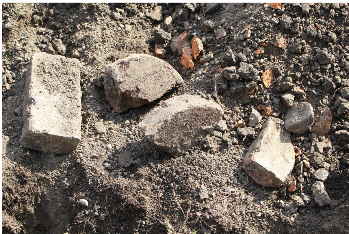
Figur 3. Fyra tegelstenar som kom i schaktets nordöstra del. Möjligen kommer tegelstenarna från byggnader tillhörande klostret.

En kort slänt med utfylld sand ledde från församlingsgården ner mot Kyrkogatan. Resten av undersökningsschaktet bestod av utfyllnads- och raseringsmassor och utgjordes av sten, grus och lerinblandad sand blandat med tegelkross. Lagret, som var omkring 0,4–0,5 meter tjockt, innehöll mer tegelkross öster om Kyrkogatan, här påträffades även hela tegelstenar (figur 3). Tegelstenarna kan ha tillhört byggnader i klostret. Samtidigt var antalet stenar färre och även mindre än vid Kyrkogatan. På ett par ställen i schaktet kom det även fram djurben. Bland ytterst få fynd från undersökningen hörde buteljglas och ett skaft av en kritpipa. En betongklump påträffades i övergången mellan allén och gräsytan.