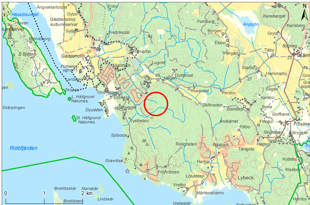
Figur 1. Utredningsområdet vid Gäddholm, sydöst om Västerås. Mot bakgrund av Terrängkartan, skala 1:50 000.