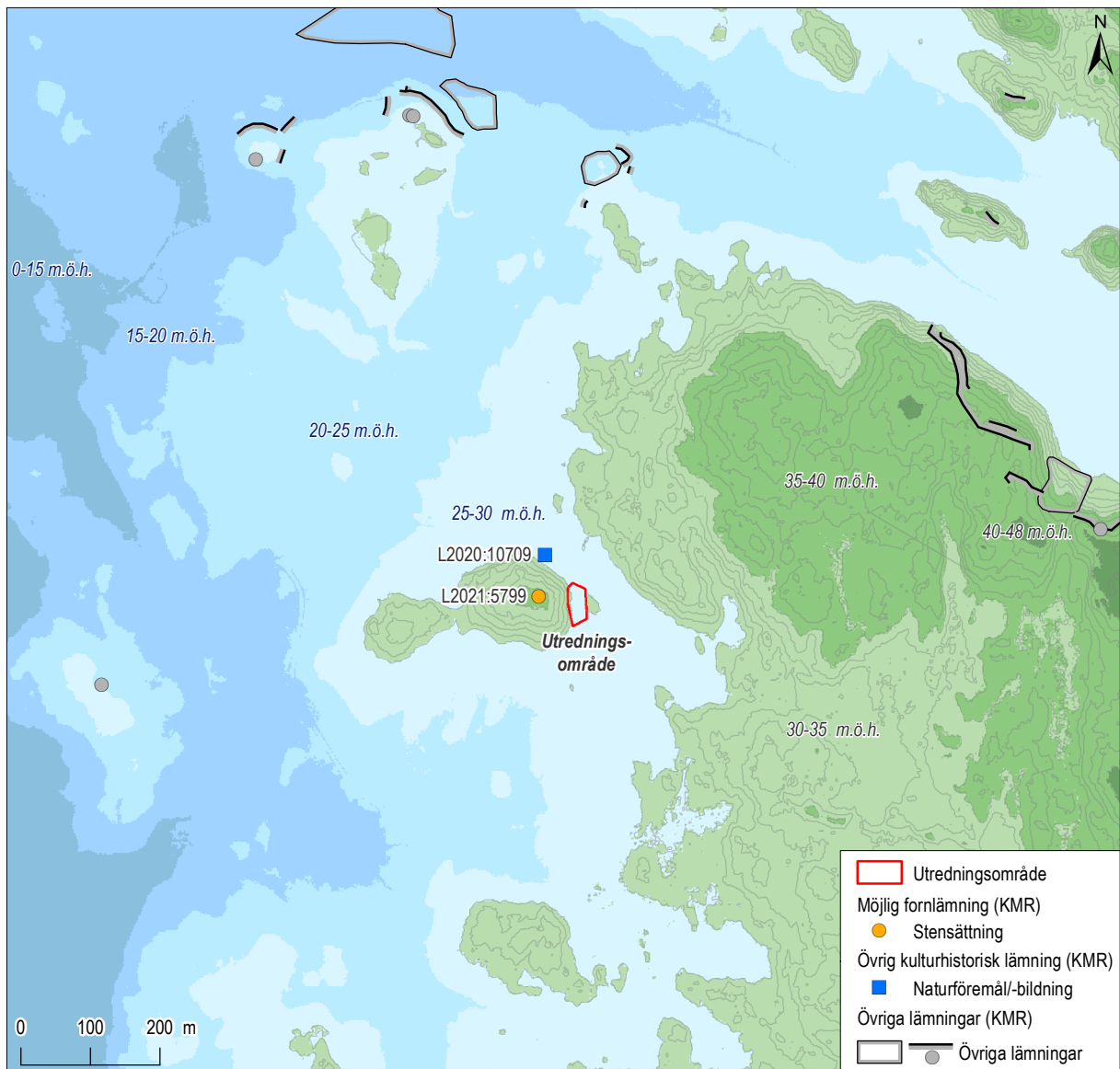
Figur 3. Strandlinjenivån 2300 f.Kr., cirka 30 meter över havet samt lämningar i närområdet enligt Kulturmiljöregistret (KMR). Skala 1:10 000.

Området steg upp ur havet under yngre stenålder (senneolitikum) eller möjligen äldre bronsålder, där de idag mer höglänta områdena utgjorde öar i en ytterskärgård. Cirka 15 kilometer norrut har gropkeramiska boplatser påträffats på områden som låg omkring 30–40 meter över havet på en plats som under yngre stenålder utgjorde en innerskärgård (Björklund 2013, s. 12). Det är därför tänkbart att det kan återfinnas små säsongsvisa jakt-/fiskestationer i den forna skärgårdsmiljön, även om sådana för tillfället saknas i närområdet. Läget för det undersökta området låg förhållandevis lågt, runt 30 meter över havet, men söderläget i den forna skärgårdsmiljön gör det möjligt att man befunnit sig på platsen