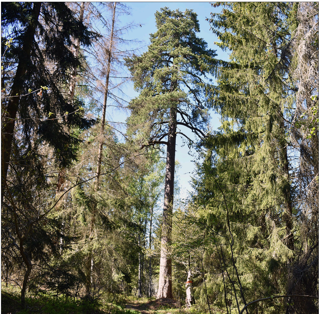
Figur 2. Den minst 200 år gamla tallen, L2020:10709. Foto från öster.

en möjlig stensättning, L2021:5799 och nedanför höjden på norra sidan återfinns ett naturföremål med namn, L2020:10709. Naturföremålet utgörs av en cirka 25 meter hög tall med ålderdomligt utseende som finns redovisad på både Ekonomiska kartan från 1961 och Fastighetskartan som "Stora tallen" (figur 2 och 3). Tallen finns omnämnd i Ortnamnsregistret från 1969 (Björklund 2020, s. 10). Tallen är omkring 200 år gammal och kommer bevaras i det planerade bostadsområdet, där det äldre landskapets naturkaraktär ämnas ta tillvara (Stadsbyggnadsförvaltningen 2022, s. 6). Tallen ligger cirka 50 meter nordväst om aktuellt utredningsområde.