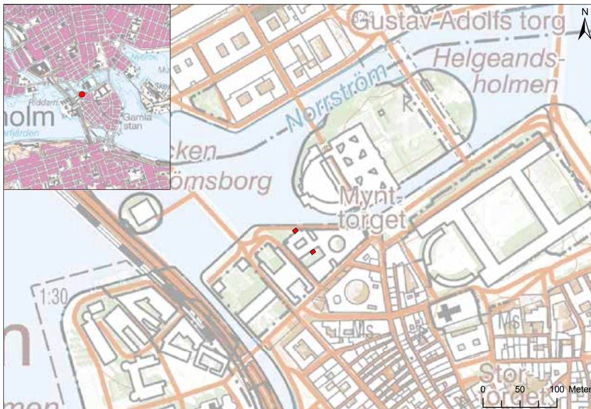
Figur 1. Schakten i kvarteret Mars och Vulcanus markerade på Fastighetskartan. Skala 1:5 000, översikt i skala 1:50 000.