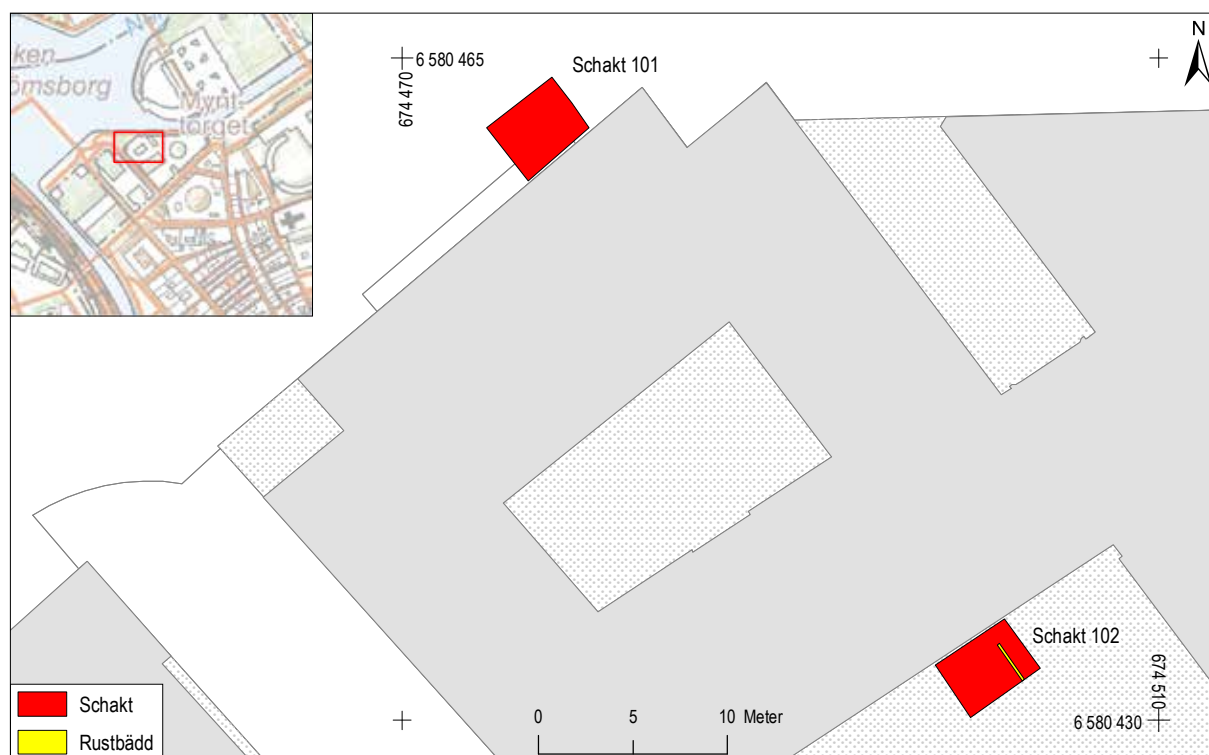
Figur 3. Schaktplan inklusive rustbädden tillhörande Rannsakningsfängelset markerade på Grundkartan, skala 1:400.

Tidigare undersökningar i anslutning till kvarteret har påträffat rester av stadsmurarna (SR39, SR11, SR135, SR 251), vidare har en myntskatt innehåll-