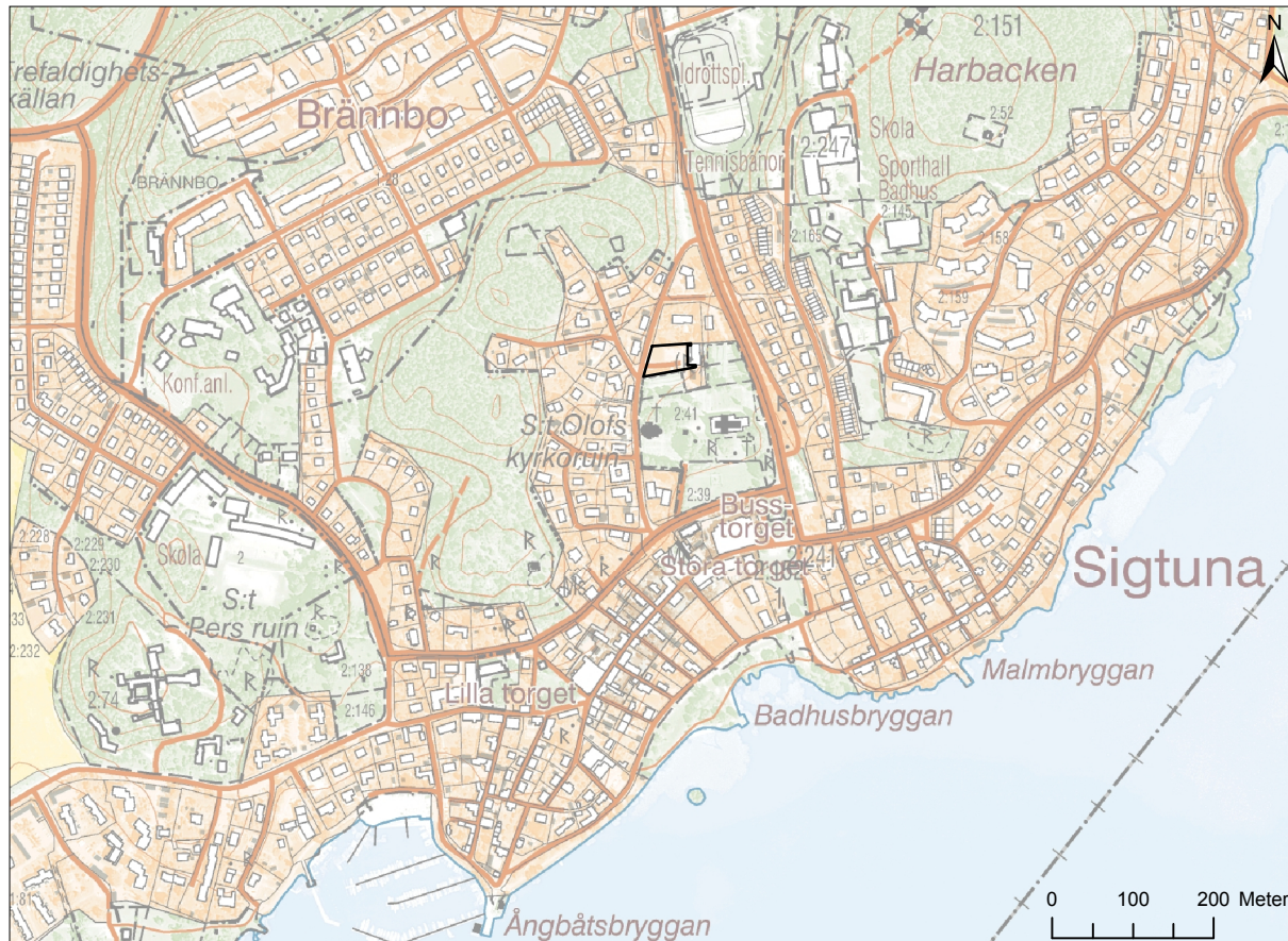
Figur 1. Fastighetskartan med undersökningsytan markerad. Skala 1:10 000

län (Lst dnr 43111-37008-2016). Anledningen till schaktningen är att en parkering och upplagsplats ska iordningställas.