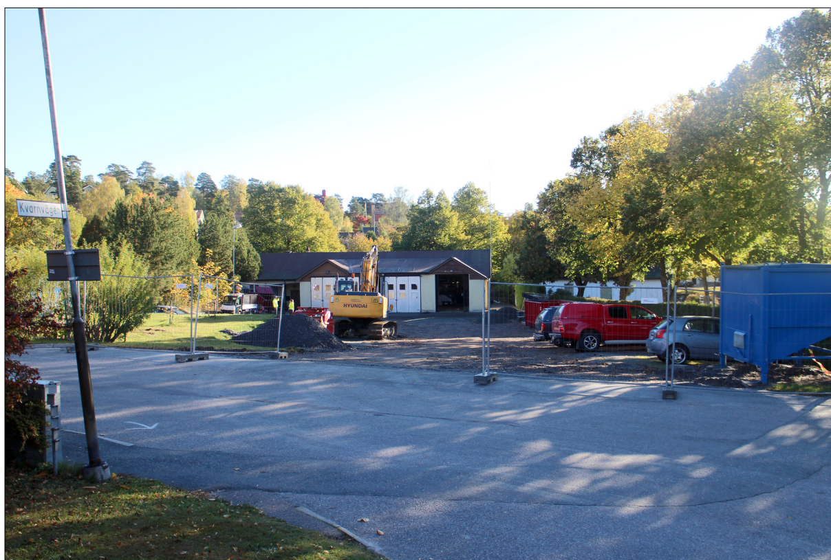
Figur 2. Översikt över ytan, bilden är tagen från väst och visar undersökningsytan, fastigheten Sigtuna 2:42.

Ytan bestod av en grusad gårdsplan som tidigare varit asfalterad parkering, samt en utfylld terrass i tomtens nordvästra del. Längs tomtens norra begränsning berördes även en plantering med träd och buskage, även en mindre gräsbevuxen yta längs en häck som avgränsar kyrkan från vaktmästeriet berördes.